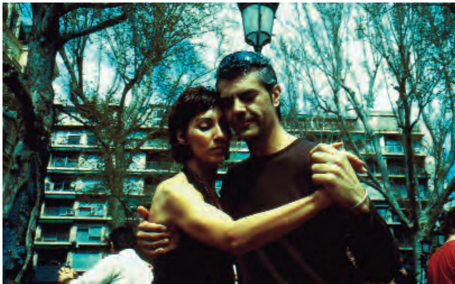
Animación urbana Fuente de las Batallas