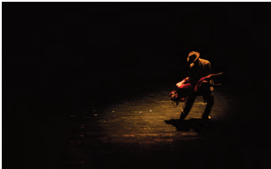
Compañía Rea Danza, tango roto Teatro Isabel la Católica