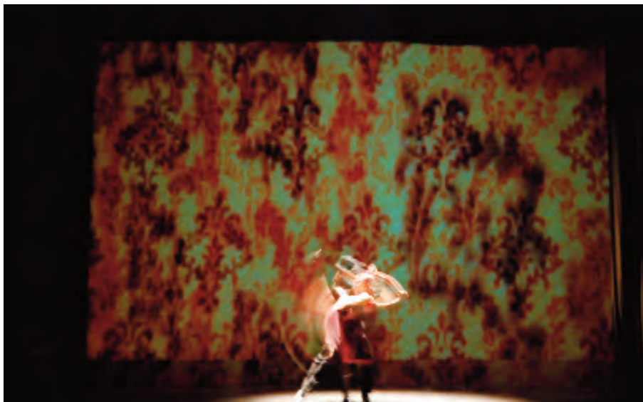
Compañía Rea Danza, tango roto Teatro Isabel la Católica