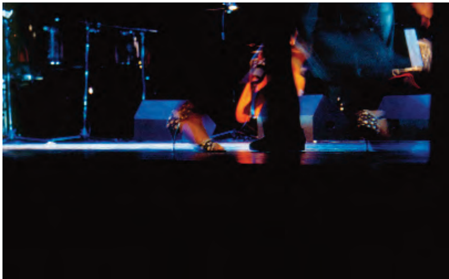
Ibertango Teatro Isabel la Católica