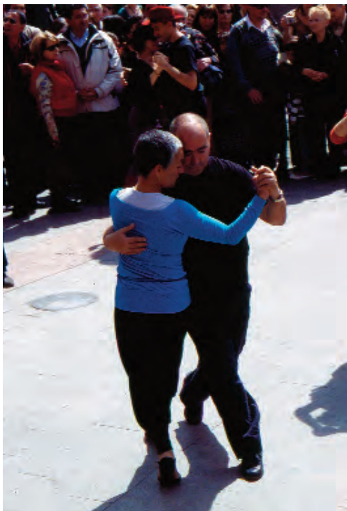
Animación urbana Fuente de las Batallas