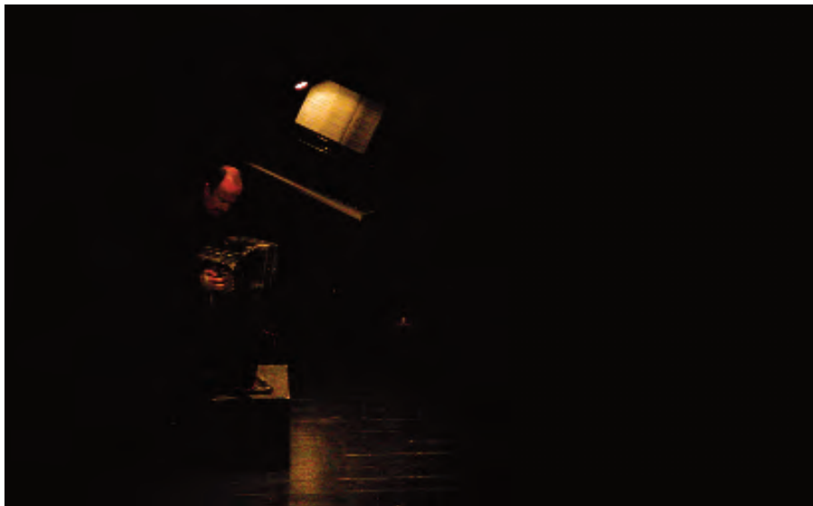
Ibertango Teatro Isabel la Católica