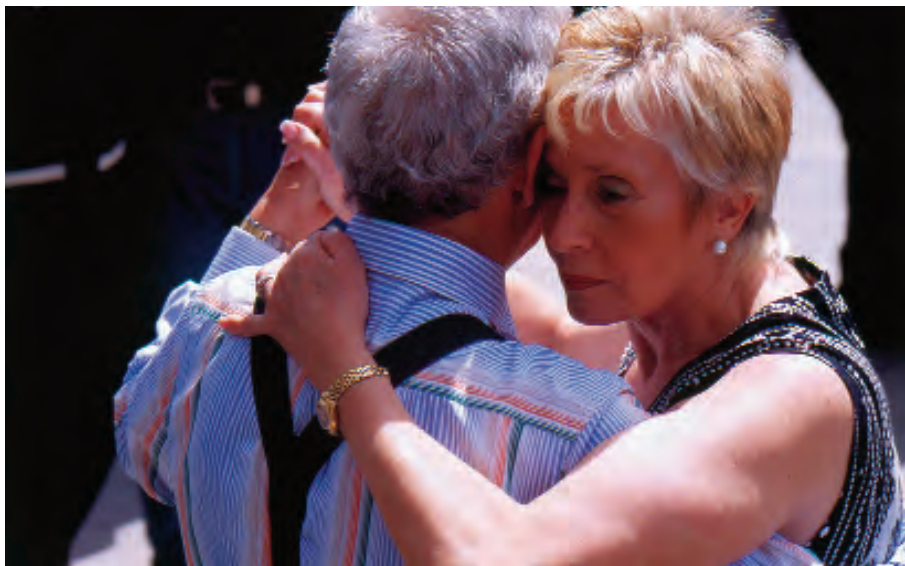
Animación urbana Fuente de las Batallas