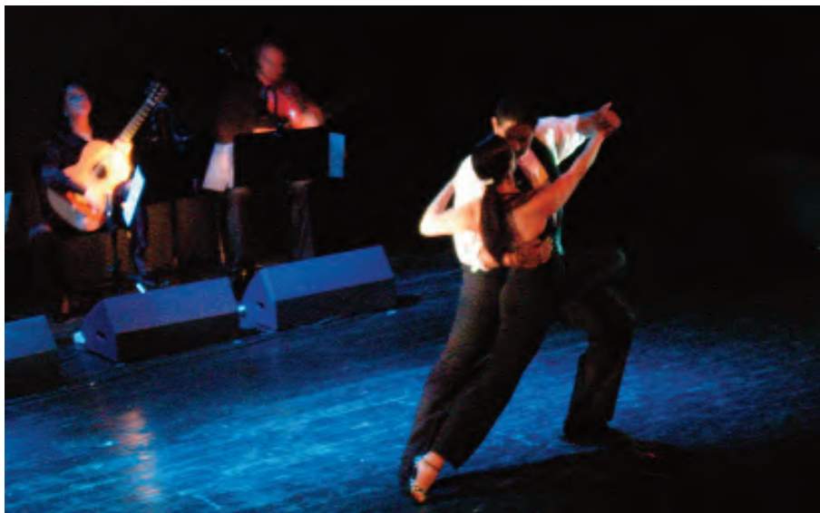
Compañía Rea Danza, tango roto Teatro Isabel la Católica