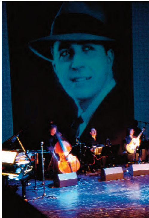
Ibertango Teatro Isabel la Católica