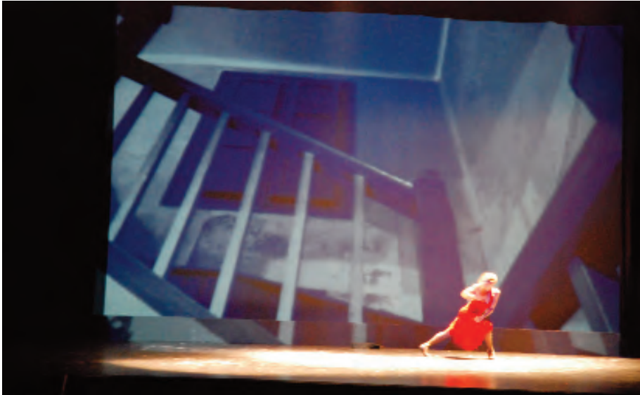
Compañía Rea Danza, tango roto Teatro Isabel la Católica