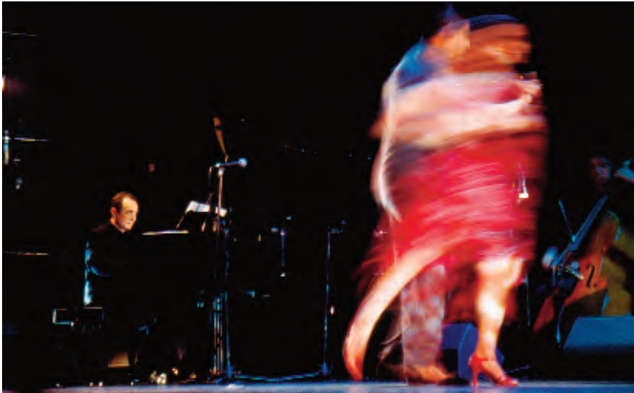
Ibertango Teatro Isabel la Católica