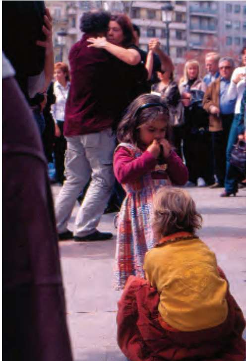
Animación urbana Fuente de las Batallas