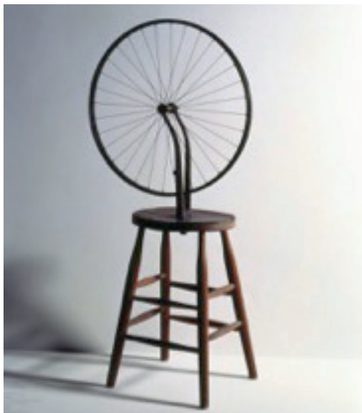
Marcel Duchamp (1963) Bicycle Wheel. Readymade.