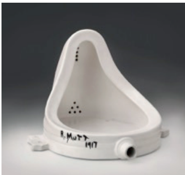
Marcel Duchamp (1917/1964). Fountain. Cerámica blanca y pintura negra, 38.1 x 48.9 x 62.5 cm.