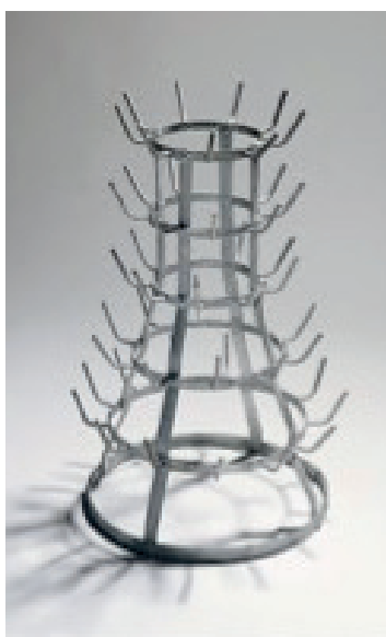
Marcel Duchamp (1914/1964) Bottle-Rack. Metal galvanizado. 64 x 24 cm.