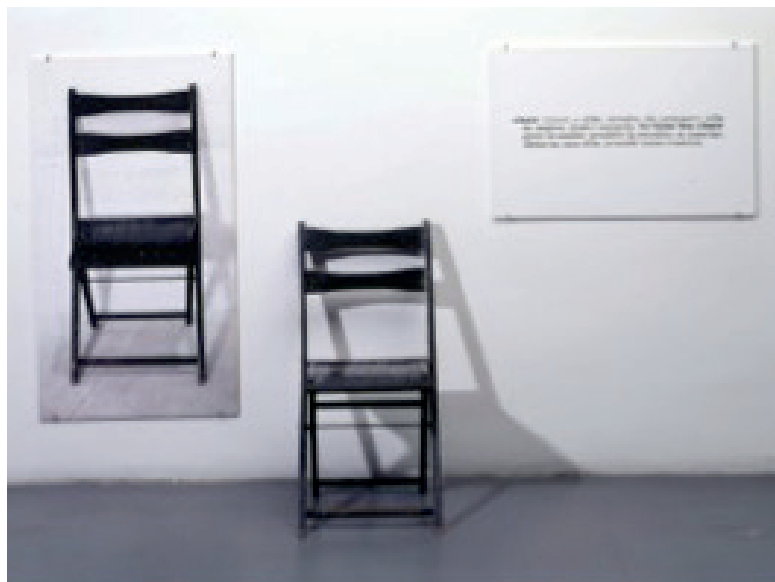
Joseph Kosuth (1965) One and Three chairs. Fotografía en blanco y negro y silla. Pieza derecha: 52 x 80 cm / Pieza izquierda: 110 x 60 cm Pieza central: 81 x 40 x 51 cm.