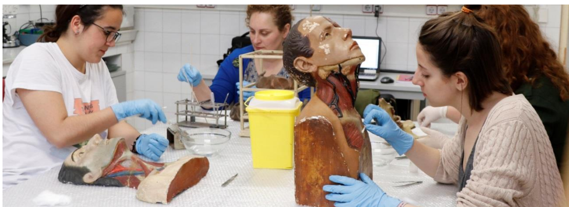
Desarrollo de las intervenciones a cargo del equipo de trabajo.

Las piezas de papel maché fueron sometidas a un proceso ligero de fijación y limpieza simultáneas en las zonas más afectadas como medida curativa básica para posibilitar su exhibición.