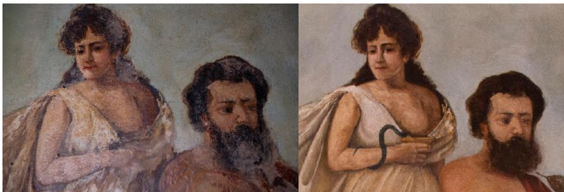
Aspecto del “antes” y el “después” de la parte central de la pintura.

tonalidades mediante rigatino. Finalmente el lienzo se montó sobre un soporte rígido y junto a su marco, también restaurado, se instaló en el techo de la botica.