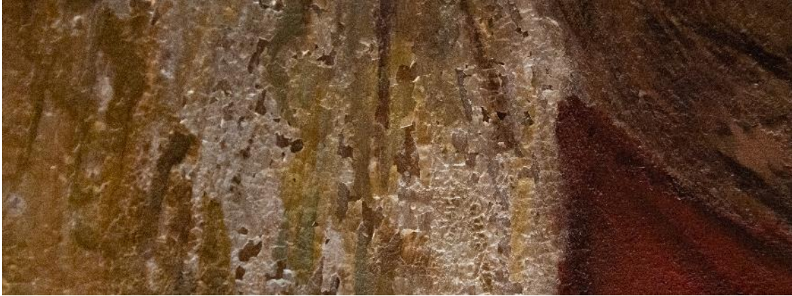
Aspecto del craquelado y pérdidas en la policromía.

capa de policromía mostraba intensos craquelados y una notoria pérdida de capa pictórica, especialmente en la zona central del lienzo, en parte, cubierta por grandes repintes de tosca factura. Además, el barniz final estaba pasmado y amarillento y se veía muy oscurecido a causa de la acumulación de polución y suciedad. El marco estaba descuadrado, tenía pérdidas puntuales y estaba recubierto por un repinte generalizado donde se había acumulado polvo y suciedad.