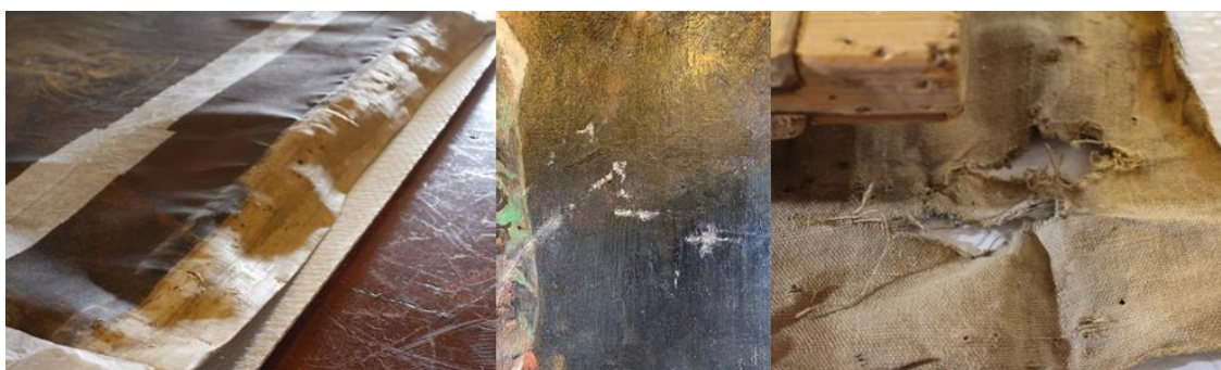
Deformaciones en el lienzo; arañazos y pérdidas de la capa pictórica, roturas y desgarros en la tela

La capa de barniz, debido a su oxidación, había perdido casi por completo sus características físicas de transparencia y brillo alterando así el cromatismo original de la escena.