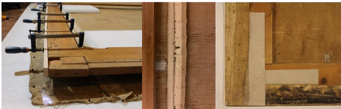
Recrecido del bastidor; parches de lino y refuerzos de esquinas.

Una vez finalizado todo el tratamiento de refuerzo y eliminación de deformaciones de la tela se procedió al tensado mediante tenazas metálicas y a la sujeción con grapas de acero inoxidable, interponiendo entre éstas y la tela original una cinta de algodón en color lino del mismo ancho del bastidor.