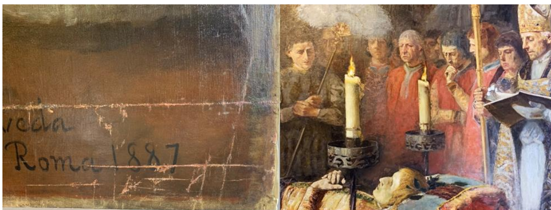
Estucado y reintegración cromática.

zona inferior, el largo de la costura y el lateral izquierdo. Una vez nivelados los estucos se procedió a entonar de color con acuarela, mediante tintas planas para acercar el tono del estuco al de la obra.